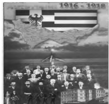
Εικόνα 8. Αφίσα με το «αυτόνομο κράτος του Πόντου». Διακρίνεται το Εθνικό Συμβούλιο του Πόντου Στο Βατούμ.