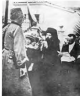
Εικ. 2 Ο Δήμαρχος Τραπεζούντας Τριφαντίδης και ο Μητροπολίτης Χρυσάνθος προσφωνεί τον Μεγ. Δούκα της Ρωσίας Νικολάγιεβιτς