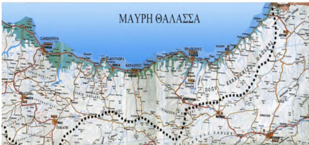
ΧΑΡΤΗΣ 5 Ο ΣΥΓΧΡΟΝΟΣ ΠΟΝΤΟΣ