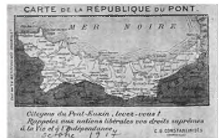
Εικόνα 6. Επιστολικό δελτάριο με Χάρτη της «Δημοκρατίας του Πόντου». Εκδόθηκε το 1917 από τον Κωνσταντινίδη στη Μασσαλία, για την υποστήριξη του αιτήματος ανεξαρτησίας.