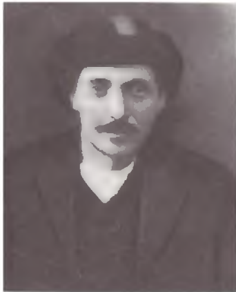
Εικ. 1. Ο θρυλικός καπετάν Ευκλείδης, ηγέτης ανταρτών της Σάντας