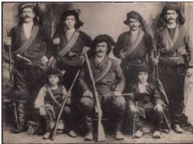
Εικ.4. Ριζούντα, αντάρτες πιθανότατα μέλη της ίδιας οικογένειας.