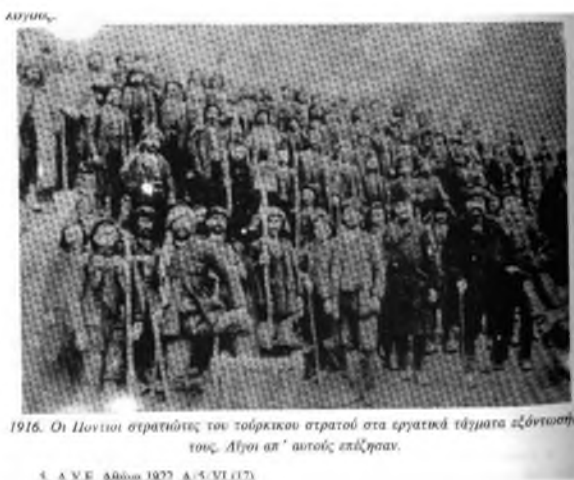
1916. Οι Ποντιοί στρατιώτες του τουρκικού στρατού στα εργατικά τάγματα εξόντωσής τους. Αίχμη απ' αυτούς επέζησαν.