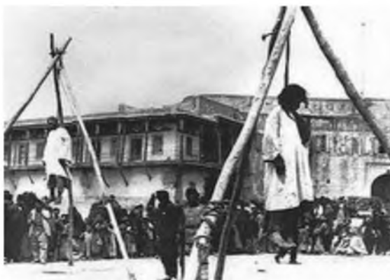
Εικόνα 7. Οι κρεμάλες των «δικαστηρίων της ανεξαρτησίας» της Αμάσειας.