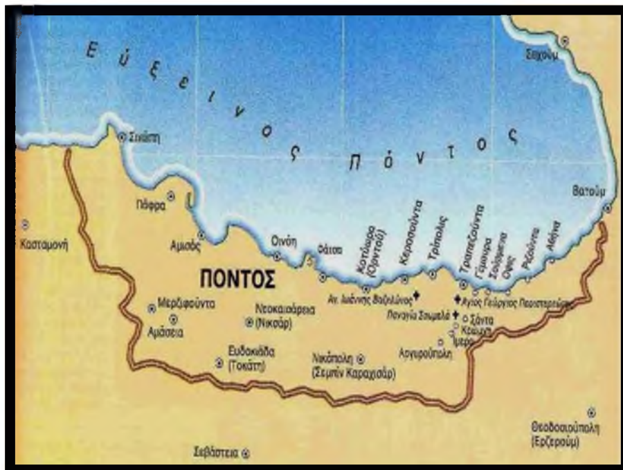
ΧΑΡΤΗΣ 1. Ο ΠΟΝΤΟΣ