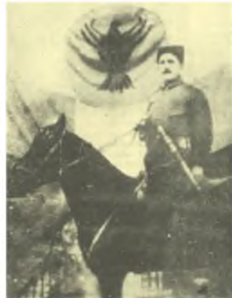
Ο οπλαρχηγός Αρμά-αγάς, διαπερνάει σε πολλές μάχες ελατήριο δυνάμει του τακτικού τουρκικού στρατού. Πιο διακρίνεται η σημαία της Διαμεταρτίας του Πόντου.