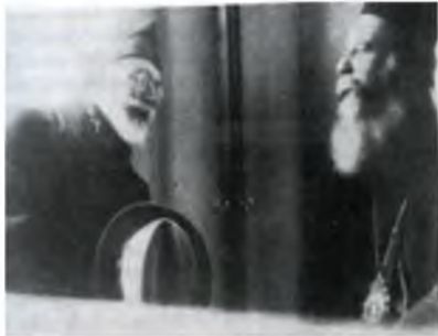
Εικόνα 1. Ο Μητροπολίτης Χρυσάνθος με τον Βενιζέλο