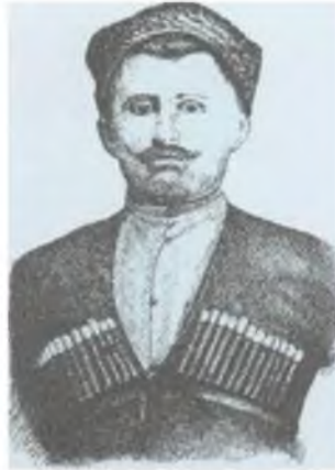
Εικ.2. Ο θρυλικός καπετάνιος/Στρατηγός Βασίλ Αγάς, (Βασίλειος Ανθόπουλος)