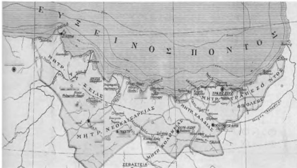
ΧΑΡΤΗΣ 4. Η ΘΡΗΣΚΕΥΤΙΚΗ ΟΡΓΑΝΩΣΗ ΤΟΥ ΠΟΝΤΟΥ