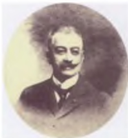
Εικόνα 4. Κωνστανίνος Κωνσταντινίδης υπήρξε ο πιο δραστήριος της προσπάθειας για την ίδρυση της Δημοκρατίας του Πόντου.