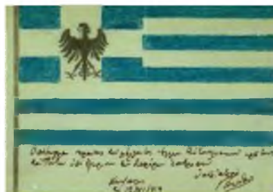
Εικόνα 5. Η Σημαία του προς σύσταση «Ποντιακού Κράτους»