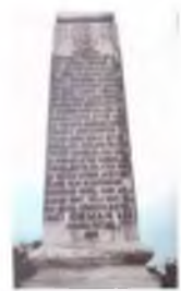
Εικόνα 3. Ο Τοπάλ Οσμάν στον ΑΠΠ και το μνημείο του στην Κερασούντα