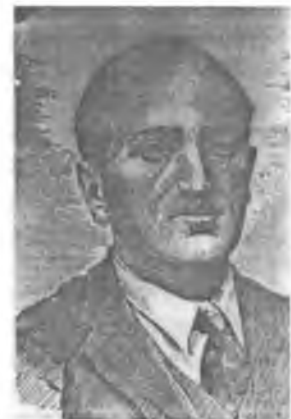
Φίλων Κτενίδης (σκίτσο) 2

Ἡ βεβαιότητα τῆς ηγεσίας τοῦ ποντιακοῦ ἐλληνισμοῦ γιὰ τὴν ελευθερία τοῦ ἔφτασε σε τέτοιο σημεῖο, ὥστε ὁ μέγας πατριώτης Κτενίδης ἐμπνεύστηκε και σύνθεσε τὸν ὕμνο τοῦ Πόντου, που ποτέ δε μελοποιήθηκε και ποτέ δε ψάλθηκε ἀπὸ τοὺς συμπατριῶτες τοῦ. Ἡ ἐμπνευση τοῦ Κτενίδη ἀντλεῖ δύναμη ἀπὸ τὸν ἐπικό ἐνοπλο ἀγῶνα τῶν παλικαριῶν τοῦ Πόντου και συνδέεται με τὴν ἐπανάσταση τοῦ 1821 και τὸν ἐλληνισμό.