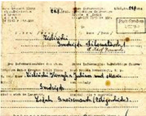
Πρωτότυπο έγγραφο της 1 ης Σύμβασης της Γενεύης

«Ο πόλεμος, που στις μέρες μας έγινε σύντομος, βίαιος και για πρώτη φορά τρομερός, με την έννοια της ικανότητας ολοκληρωτικής καταστροφής, η εξέλιξη της στρατηγικής και των μεθόδων διεξαγωγής των συγχρόνων συγκρούσεων και η διαπίστωση της αδυναμίας των υφισταμένων κανόνων «εξανθρωπισμού» του πολέμου, οδήγησαν σε μία απόπειρα εκσυγχρονισμού του Διεθνούς Ανθρωπιστικού Δικαίου και συγκεκριμένα των τεσσάρων Συνθηκών της Γενεύης του 1949. Τα δύο Πρόσθετα Πρωτόκολλα του 1977 απέχουν πολύ από του να χαρακτηρισθούν ικανοποιητικά.» 1