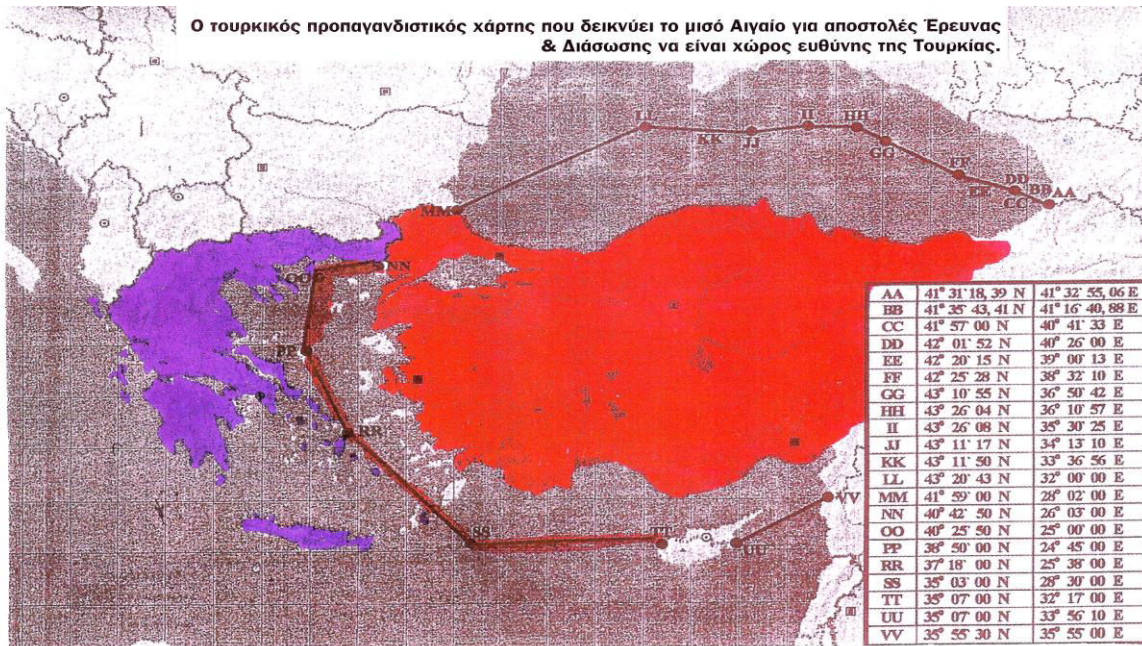
Εικόνα 2: Ο χάρτης της περιοχής έρευνας και διάσωσης υπό τουρκική δικαιοδοσία (συνημμένος στον Κανονισμό 13559 / 1988).

19. Η προκλητική αυτή ενέργεια εγκλωβισμού ελληνικών νήσων, ελληνικών χωρικών υδάτων και ελληνικού εναερίου χώρου στην τουρκική περιοχή έρευνας και διάσωσης, σαφώς παραβιάζει την κυριαρχία και κυριαρχικά δικαιώματα της Ελλάδος. Η δε συμπερίληψη τμήματος του FIR Αθηνών στην τουρκική περιοχή ευθύνης, πέραν του ότι στερείται επιχειρησιακής αποτελεσματικότητας, παραβιάζει ελληνικές αρμοδιότητες εκχωρημένες από τον ICAO. Επίσης, έρχεται σε αντίθεση με τη γενική διεθνή πρακτική (εθιμικό δίκαιο), αλλά και τις συστάσεις του IMO και ICAO, που περιλαμβάνονται στο IAMSAR Manual (International Aeronautical and Maritime Search and Rescue Manual / Διεθνές Εγχειρίδιο Αεροναυτικής και Ναυτικής Έρευνας και Διάσωσης), προκρίνοντας την υιοθέτηση ταυτόσημων περιοχών για την παροχή υπηρεσιών έρευνας - διάσωσης σε ναυτικά και αεροπορικά ατυχήματα, κατά τρόπο που να συμπίπτουν με τα όρια των FIRs